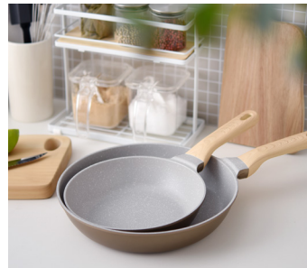
キッチンになじむデザイン