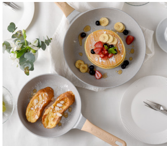
やさしく落ち着いたカラー