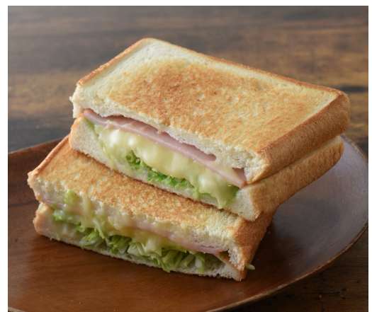
▲普通の食パンだとお腹いっぱいになっちゃう…