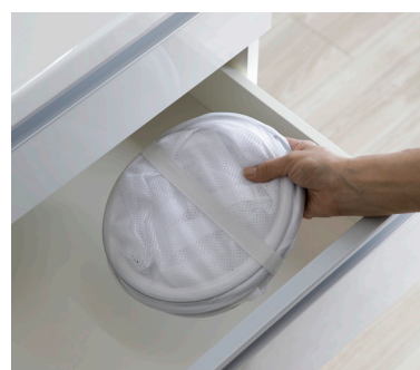
小さく畳んで収納可能