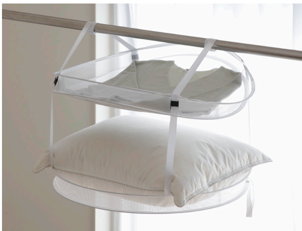
▲干したい量や種類によって段数を変更可能。

1段から最大4段まで自在に分割と連結できるので、使用シーンに応じて必要な段数に変えて干すことができます。